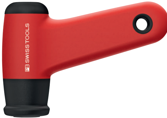
Pistol grip 3,2–16,0 Nm Mango de pistola 3,2–16,0 Nm

WITH DIGITAL DISPLAY CON PANTALLA DIGITAL